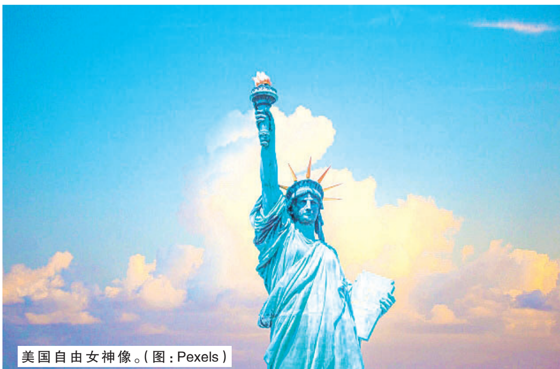
美国自由女神像。

美国新任国务卿布林肯(Antony Blinken)日前在参议院听证会发言,表示美国将扮演捍卫彩虹族群权利、国务卿将承担其责任等,但有网民批评他为践踏《圣经》的愚人。